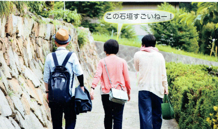
この石垣すごいねー！

異業種の3人が集まって、「ステキいなか暮らし」をモットーに楽しいツアーを計画中。地元の不動産巡りやリノベーション古民家見学、地域の面白い所やイベント、人と食にふれる楽しいツアーです♪