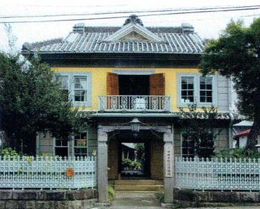
擬洋風建築の旧田中銀行