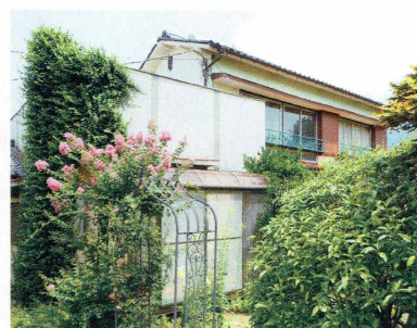
ぶどう畑に囲まれた貸農家民家