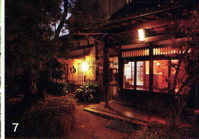
1:若者が憩うザルトベルクコーヒー / 2:「飲食店×地域づくり」がコンセプトの談話室コロボックル 3:甲州市、山梨市で約45のワイナリーがある / 4:甲州兜造りの古民家が残る塩山 5:甲府盆地と塩山のシンボル塩の山を望む / 6:四季折々の果物がこんなに身近に楽しめる 7:国の登録有形文化財に選ばれた岩下温泉旅館旧館