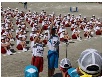
両校代表による選手宣誓

塩山北中はどこの学校にも決して負けない学校です。自信と誇りをもって、全員でさらなる進化・発展をさせていきましょう。