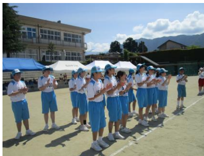
仲間を一生懸命応援