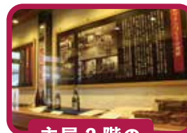
主屋 2階の 展示室